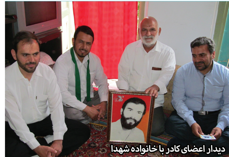
دیدار اعضای کادر با خانواده شهدا

واحد راویان شهادت با هدف ترویج فرهنگ ایثار و شهادت، معرفی شهدای استان و انتشار اندیشه های ناب شهیدان ایجاد شده است. از فعالیت های مهم این بخش میتوان به نام گذاری تمام مراسمات هیات بنام مقدس یکی از شهدا، دعوت از خانواده آن شهید در مجالس هیات، هماهنگی دیدار اعضای کادر با خانواده شهدا و به روز رسانی تابلو شهدا که مختص عکس و وصیتنامه شهید مخصوص هر مجلس است و همچنین مزین است به قسمتی تحت عنوان پیام ولایت که مشتمل بر فرمایشات مقام معظم رهبری می باشد.