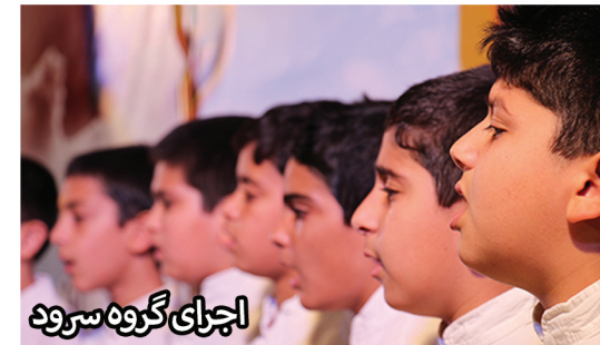
اجرای گروه سرود