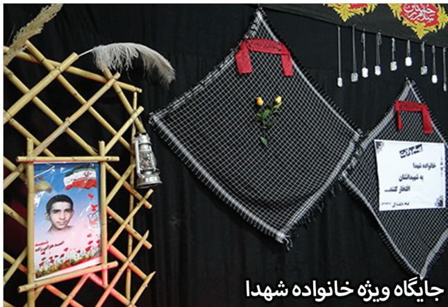
جایگاه ویژه خانواده شهدا