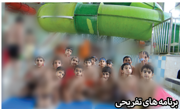
برنامه های تفریحی

هدف اصلی از پایه ریزی حوزه نوجوانان تربیت نیروی مؤمن انقلابی برای خدمت به انقلاب اسلامی و آشنایی آن ها با معارف دینی و مهارت های زندگی می باشد. از اهم برنامه های حوزه نوجوانان برگزاری دوره تابستانه معجون خنک با هدف ارتقاء سطح علمی و مهارتی نوجوانان می باشد.