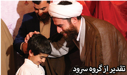
تقدیر از گروه سرود

گروه سرود بچه های بهشت از بخشهای حوزه نوجوان می باشد که با هدف جذب استعداد ها، ارائه الگوی درست سرود خوانی انقلابی و همچنین اجرای برنامه در مراسمات مختلف هیات انصار ولایت و سایر مجموعه های جبهه فرهنگی انقلاب ایجاد شده است. از اهم برنامه های گروه سرود باز سازی سرود های پایانی و نواهای اجرا شده در هیات انصار ولایت به صورت سرود های استودیویی است.