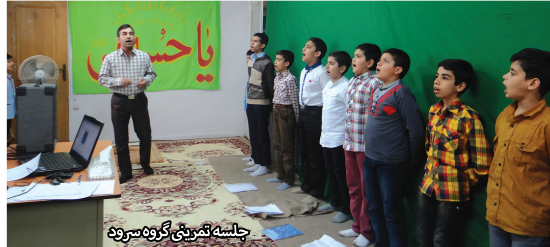
جلسه تمرینی گروه سرود