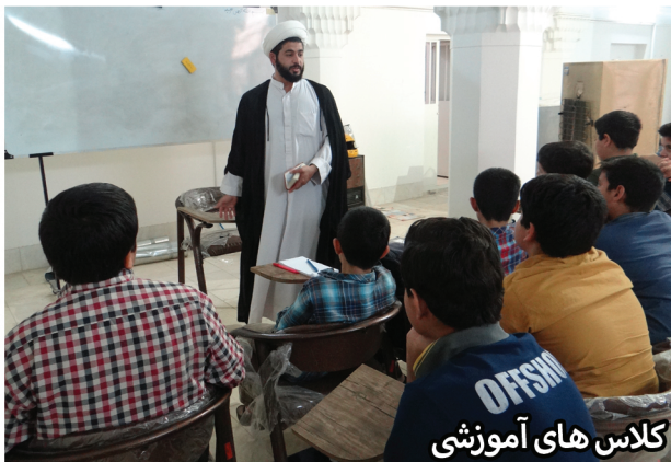
کلاس های آموزشی