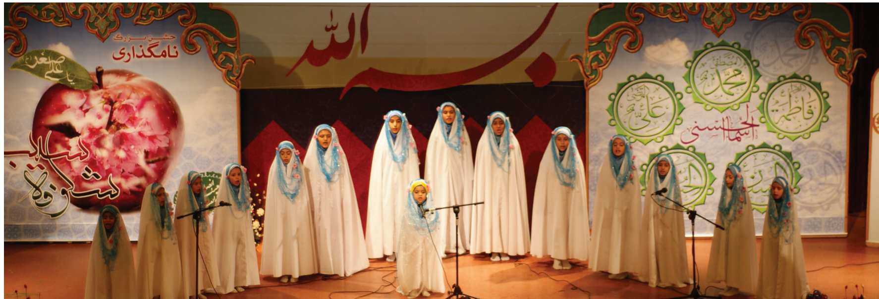
اجرای سرود پایانی هیئت (یا حسین یا حسین) در جشن شکوفه سیب ۱۳۹۲