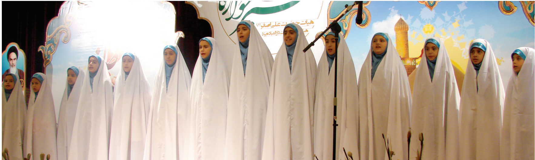
اجرای سرود پایانی هیئت (کربلا کربلا) در جشن شکوفه سیب ۱۳۹۱