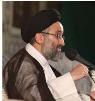
حضور بیش از ۲۰,۰۰۰ نفر مردم دارالعباده در جشن بزرگ زیر سایه خورشید