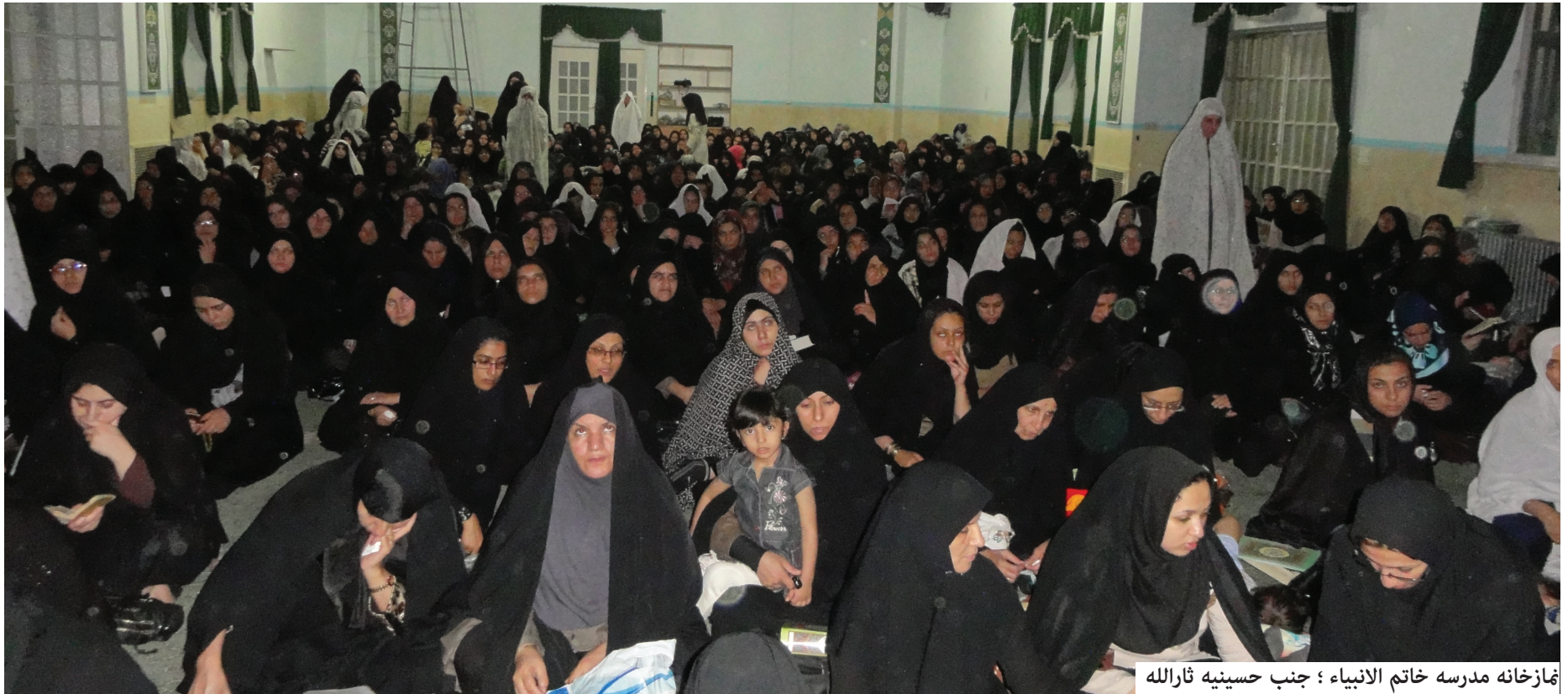
نمازخانه مدرسه خاتم الانبیاء ؛ جنب حسینیه ثارالله