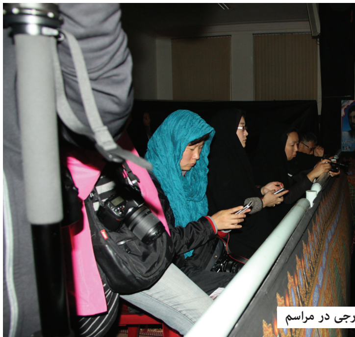
حضور گردشگران خارجی در مراسم