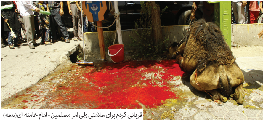
قربانی کردن برای سلامتی ولی امر مسلمین - امام خامنه ای (مدظله)