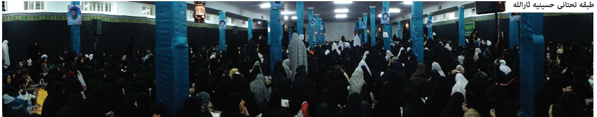
طبقه تحتانی حسینیه ثارالله