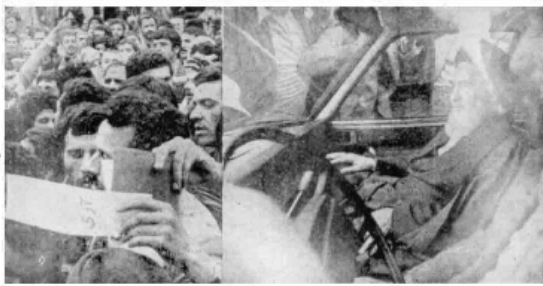
تعداد مردم در مراسم تشییع آید همدان و سرحدان با حضور مساجد و مراکز مذهبی و دانشجویان و جوانان بسیار بود. در کنار راه راه آید تشییع آید همدان و سرحدان با حضور مساجد و مراکز مذهبی و دانشجویان و جوانان بسیار بود. در کنار راه راه آید تشییع آید همدان و سرحدان با حضور مساجد و مراکز مذهبی و دانشجویان و جوانان بسیار بود.