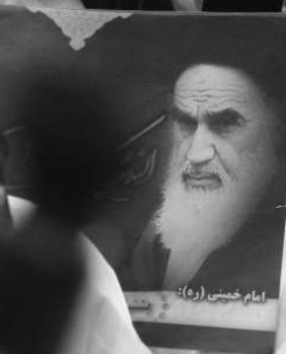
امام خمینی (ره):

لَمْ يَمُنْ سِوَاكَ اللَّهُمَّ حَامِلَةُ حُرَاي مدرسه علمیه فاطمیه پیشوا