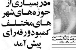
مهندس بارزگان دستوری دوایس و انقلابی جمهوری اسلامی رای میدهد

در سقز صندوق رای را آتش زدند و در کرباس کتبد می‌نویسند رفراندم انجام نشد