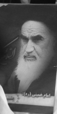
امام خمینی (ره):