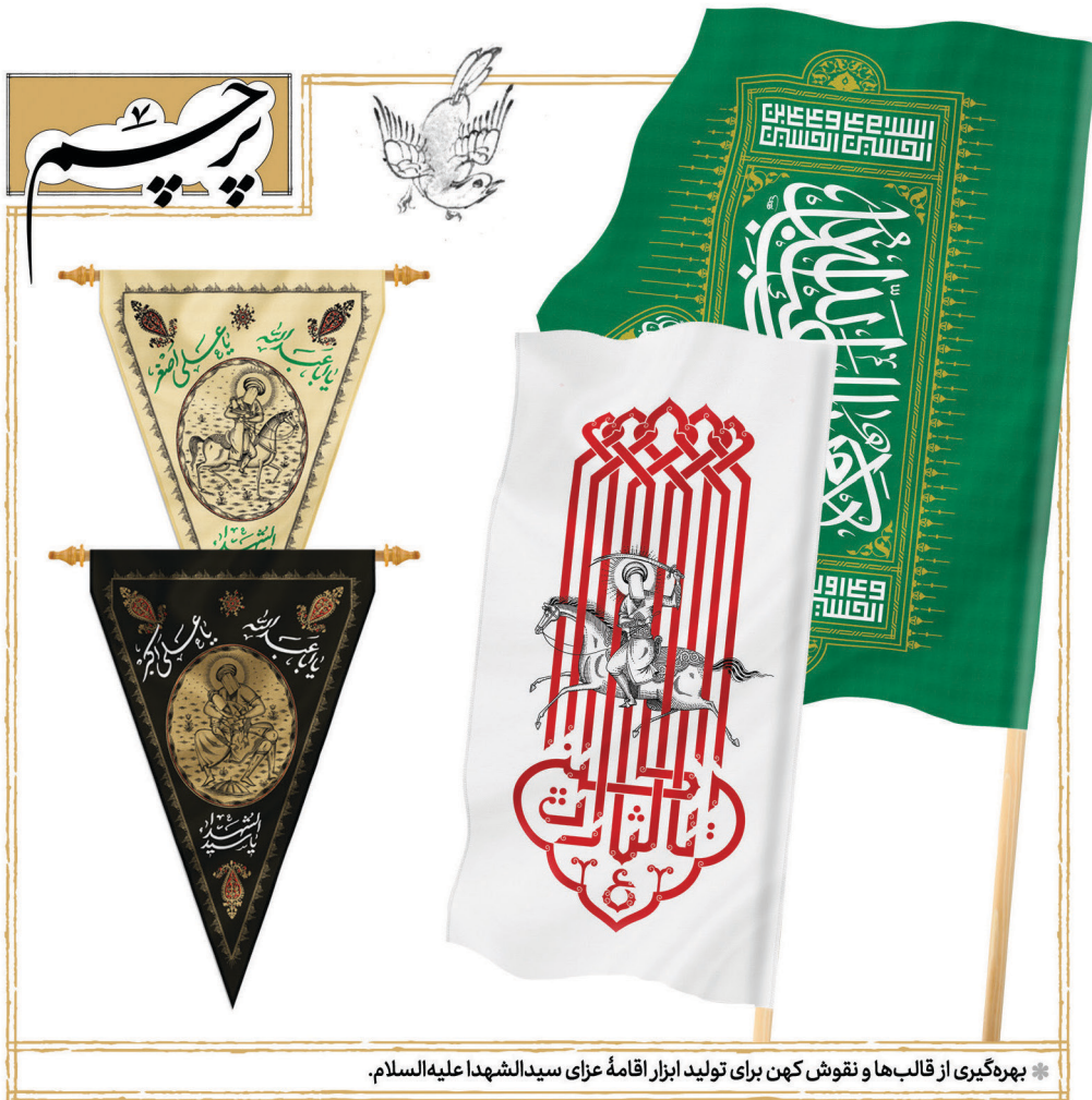
✽ بهره‌گیری از قالب‌ها و نقوش کهن برای تولید ابزار اقامه عزای سیدالشهدا علیه‌السلام.