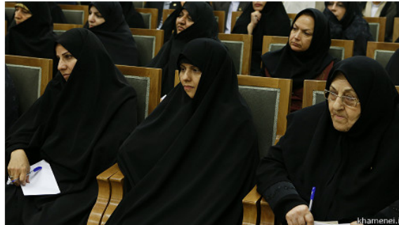
رهبر ایران با مسئولین 'جمعیت مامانی' ملاقات کرده است

به روز شده: 17:20 گرینویچ - دوشنبه 05 مه 2014 - 15 اردیبهشت 1393