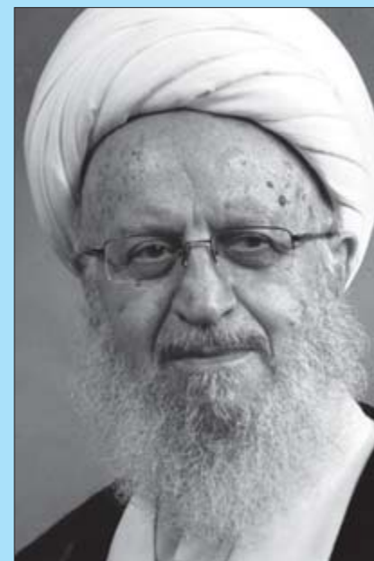
آیت‌الله العظمی مکارم شیرازی

مبلغان باید آموزش مستمر ببینند و همه ساله یک دوره آموزشی داشته باشند. باید اطلس جغرافیای تبلیغاتی کشور تنظیم شود تا معلوم شود که کدام یک از مناطق جمعیتی کشور،