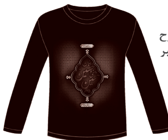
* نمونه طرح پیراهن عزیز پیامبر (۲ تا ۱۰ سال)