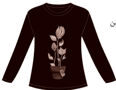
* نمونه طرح پیراهن حضرت رقیه (۲ تا ۱۰ سال)