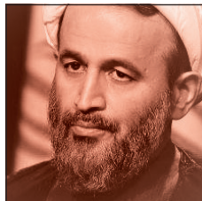
حجت الاسلام علیرضا پناهیان

«عمار» شبکه حنجره‌های پرطنین انقلاب اسلامی است که در معرکه نابرابر جنگ نرم، صدای حق را از لابلاهای امواج کور دجال‌واره‌های باطل، به فطرت‌های پاک و وجدان‌های بیدار می‌رساند تا راه گم نشود.