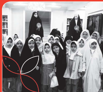
بازدید مدارس دخترانه مشهد