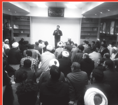
بازدید جمعی از مسئولین فرهنگی