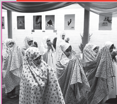
برگزاری مراسم جشن تکلیف