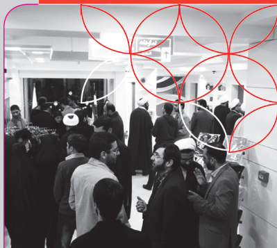
بازدید جمعی از مسئولین فرهنگی