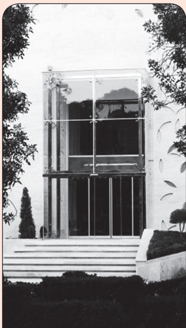
مجتمع فرهنگی فروشگاهي خانه حجاب صدف حائز رتبه در ده اثر برتر جشنواره ملی معماری ایران در سال ۱۳۹۳