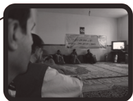
ایستگاه آتش نشانی