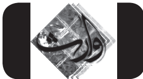
خیمه‌های برپا شده