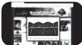
بانک جامع اطلاعات